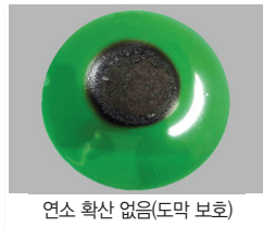
연소 확산 없음(도막 보호)