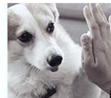
애완동물을 만진 후