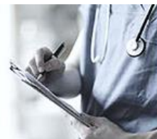
병원 방문 전후