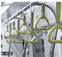
대중교통 이용 시