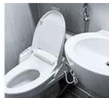
화장실 다녀온 후