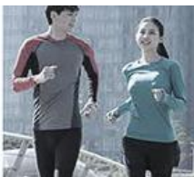
외출 시 수시로