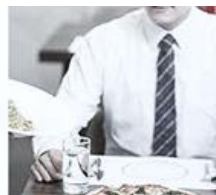
식사 전 식당에서