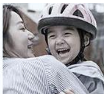
아이들 놀 때 수시로