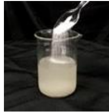
액체 락 사용