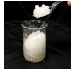
수분 내에 폐수는 운반과 처리에 편한 젤로 변화